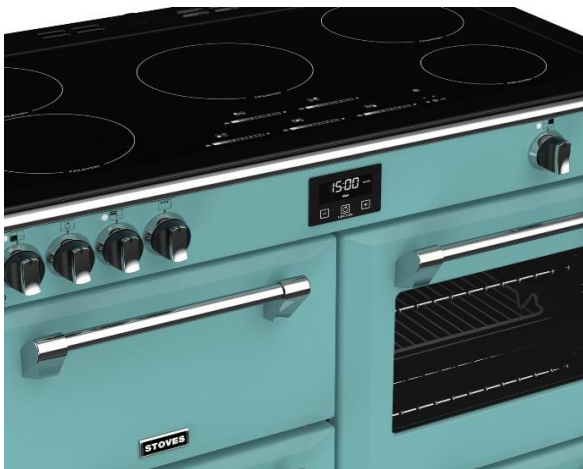
(Maxi-Clock™ LED Touch Control Timer)