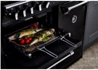
(Backblech mit Einlegerost und Griff)