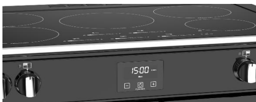
(Maxi-Clock™ LED Touch Control Timer)