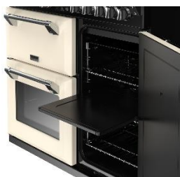
(PRO FLEX™ Unterteilung)