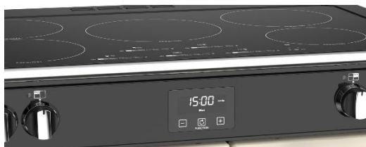
(Maxi-Clock™ LED Touch Control Timer)